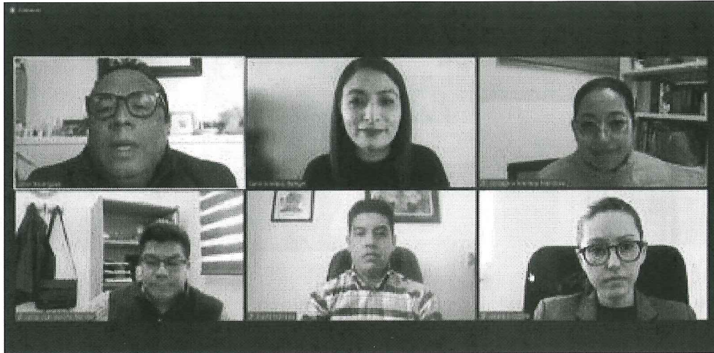
Sesión del Comité Editorial del 16 de noviembre de 2021.