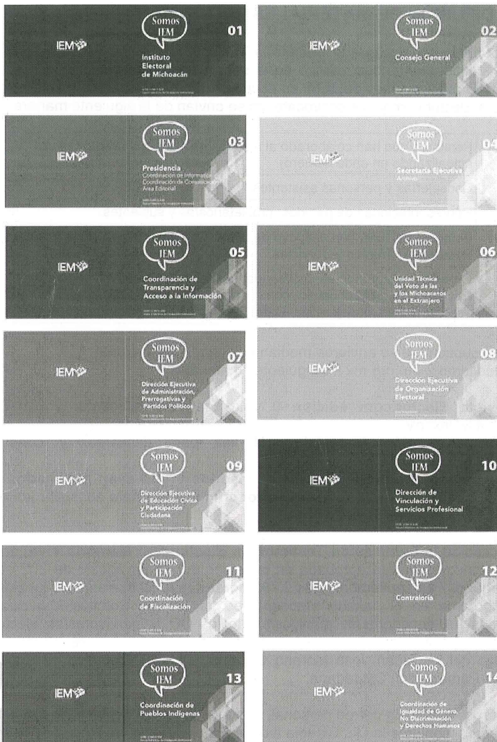
Diseño de las portadas y contraportadas finales de la colección de cuadernillos institucionales.