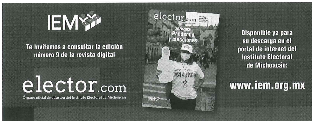
Banner de difusión digital del número 9 de Elector.com

Por primera vez se hizo una presentación pública de un número de la revista en Morelia, para lo cual se tuvo la participación de cuatro de las dieciséis personas que colaboraron en la revista Elector.com No.9 y el testimonio de una presidenta de un Comité Distrital en el pasado proceso electoral, con la finalidad de que compartan a la ciudadanía el contenido de sus artículos y la importancia de participar en estos medios de difusión electoral.