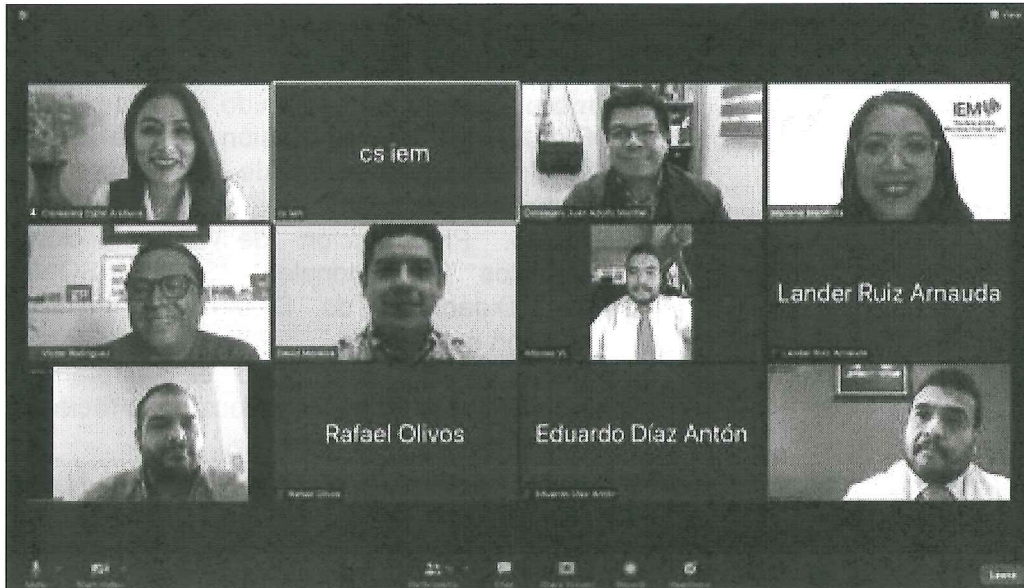
Sesión del Comité Editorial del 23 de septiembre de 2021.