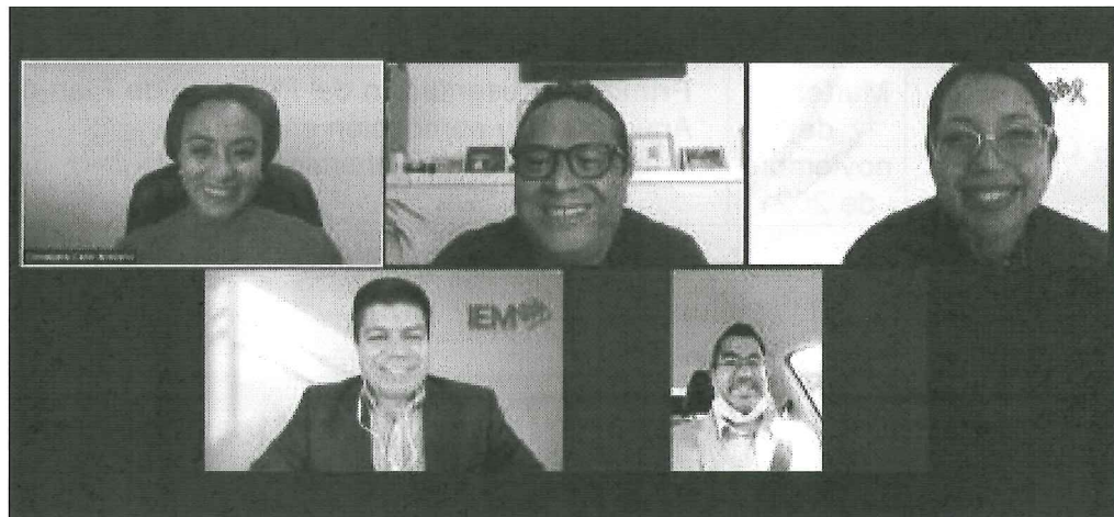
Sesión del Comité Editorial del 29 de octubre de 2021.